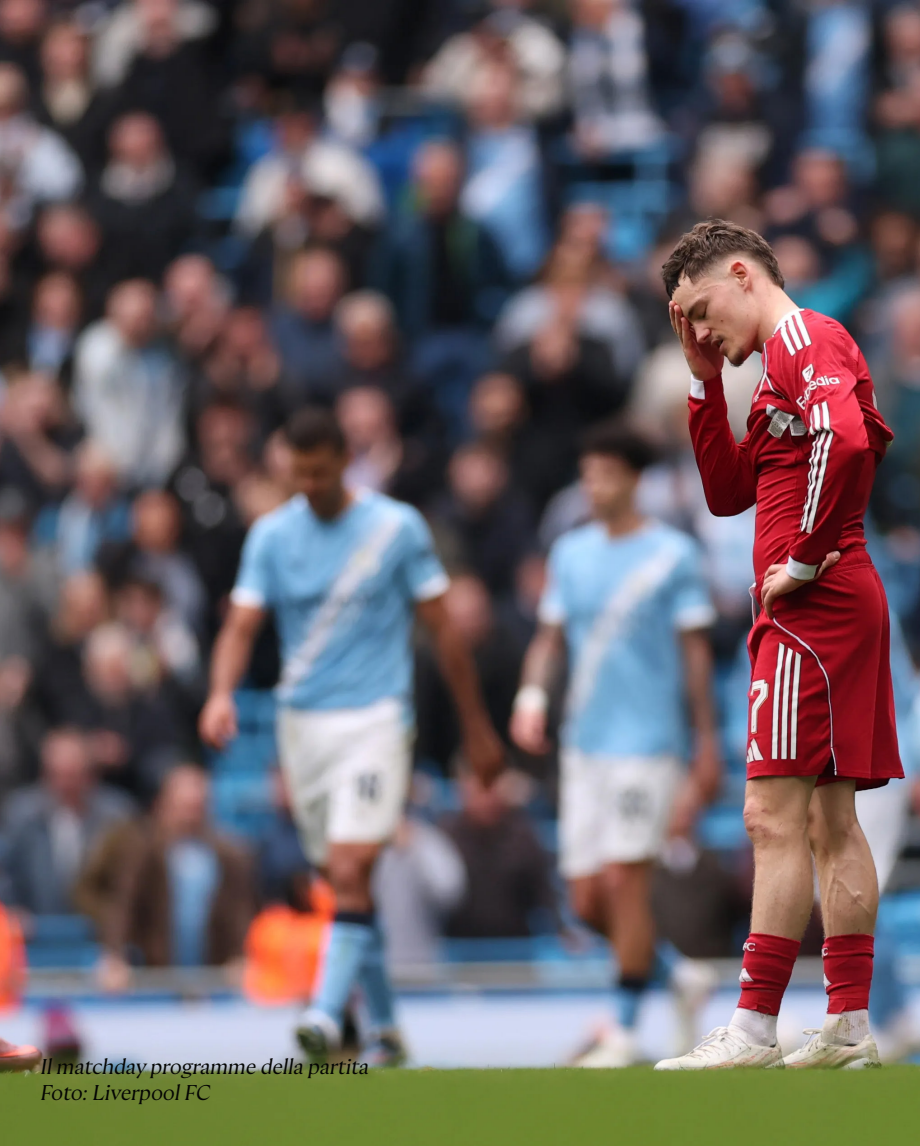
Il matchday programme della partita