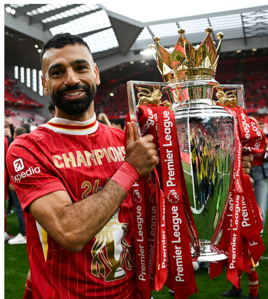
Il titolo vinto l'anno scorso in una stagione indimenticabile per l'egiziano

ra Klopp , di diventare un caso di lesa maestà. Ma c'è modo e modo per far accettare al tuo leader che il suo ruolo non è così intoccabile come quello di un tempo: lasciarlo in panchina come se fosse un ragazzino dell'Academy è un segnale forte che però non poteva che portare a una rottura. Era forse questo l'obiettivo finale del Liverpool? E poi lascia perplesso anche l'utilizzo tattico del giocatore, diverso dal passato: Slot gli chiede di giocare più esterno e di coprire maggiormente la fascia, accentrando meno. Il risultato è che il giocatore ha meno occasioni per segnare, è meno incisivo e fisicamente più in difficoltà. Il goal ritrovato, bellissimo, nel ritorno con il Galatasaray in cui Salah si è pure fatto malamente parare un rigore, faceva ben sperare. Il Liverpool ora deve già guardarsi attorno a caccia dell'erede. Ma prima il momento dell'addio, dei saluti e di infiniti tributi.