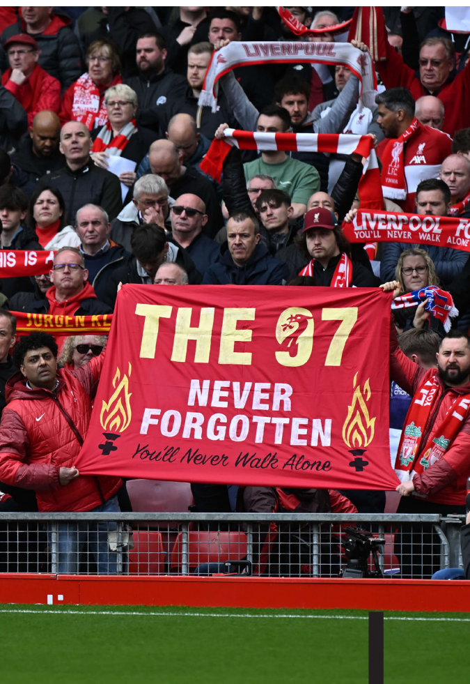
La Kop li ricorderà per sempre