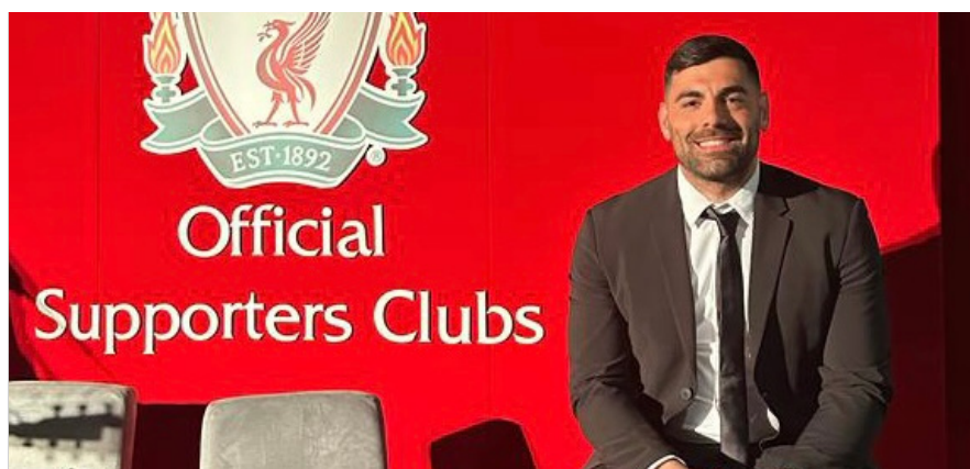
In occasione della Black Tie Dinner

gruppo, ma capisco le difficoltà che ci sono e che rendono sempre più difficile l'organizzazione.