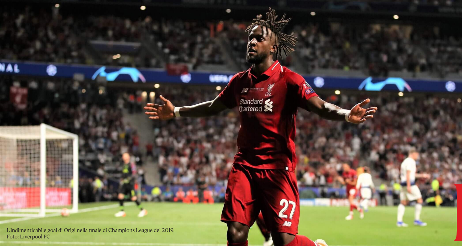
L'indimenticabile goal di Origi nella finale di Champions League del 2019.