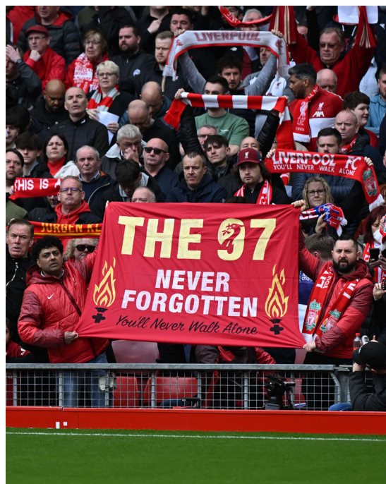
La Kop li ricorderà per sempre