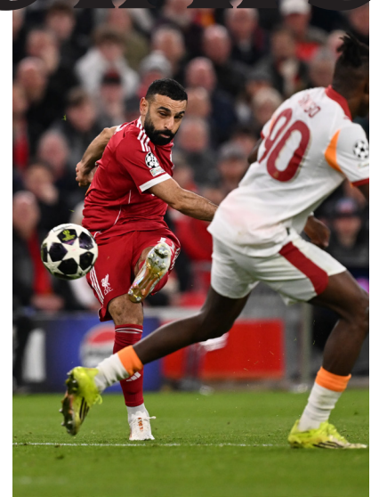
Il passaggio del turno contro il Galatasaray

terle perdere, in qualsiasi momento. La battuta d’arresto contro il Brighton è la quattordicesima stagionale, di cui dieci in Premier League, la ventesima se si allunga a tutto l’anno 2025. Un’enormità se si pensa che nei primi cinque mesi di gestione Slot ne aveva perse solo due. È davvero sorprendente come le battute d’arresto arrivino puntualmente subito dopo brevi fasi di slancio positivo. Della sconfitta contro il Bournemouth si è già detto, ma a quella era seguita la rimonta casalinga subita contro il Manchester City (decisa anch’essa da un rigore al 92’). Poi ancora due prestazioni travolgenti, con 10 gol complessivi rifilati a Qarabag e Newcastle , prima dell’inspiegabile caduta contro il Wolverhampton , super fanalino di coda in Premier League, che ha interrotto una striscia di quattro vittorie con 10 reti segnate e 3 clean sheet. Infine, l’ultimo stop contro il Brighton, arrivato a pochi giorni dal