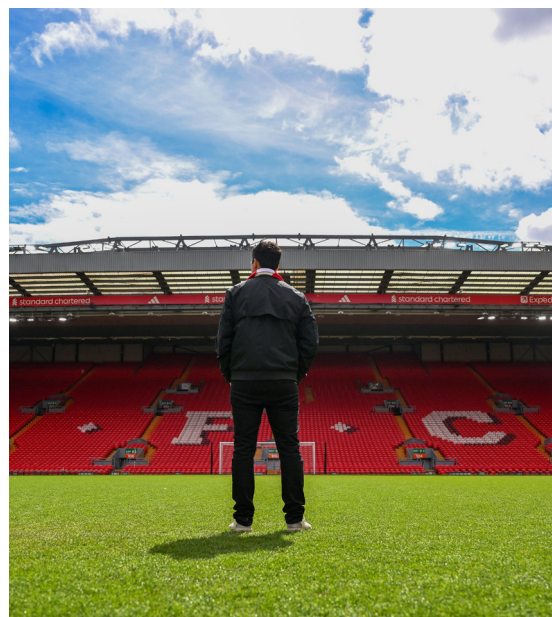
La prima visita ad Anfield

esempio: le Cherries, in questa stagione trionfale, hanno collezionato la bellezza di 18 pareggi in campionato e solo il Newcastle ha perso più punti in partite in cui stava vincendo. Il Bournemouth in 23 partite che stava conducendo ha finito con il pareggiarne 8 e perderne 2. Nessuno ci ha fatto caso, al Liverpool sarebbe inaccettabile. Insomma, l'asticella ora si alza terribilmente. Ma il calcio che ha messo in mostra a Bournemouth è stato il più bello visto in Inghilterra quest'anno e i Reds sanno cosa significhi intensità e pressing. Un giorno a Iraola, lettore onnivoro, hanno domandato un paragone letterario per il suo Bournemouth e lui ha citato Frankenstein, “un romanzo in cui creano qualcosa senza conoscerne le ripercussioni, bisogna saper rischiare e imparare dagli errori. L'importante è che se fallisci lo fai con le tue idee. Fortuna che nel calcio non è come nel libro, la cosa peggiore che può succedere è che ti esonerano” . Mary Shelley, che Frankenstein l'ha scritto, è sepolta proprio al centro di Bournemouth, quando Iraola l'ha saputo c'è andato in pellegrinaggio. Nel frattempo il suo mostro non l'ha fermato nessuno. Apparentemente semplice, ma dietro c'è elettricità, genio e metodo: si può fare.