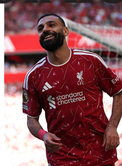
L'ultimo assist di Salah nella partita finale

della vittoria. Per non parlare della sensazione di piena impotenza dimostrata nel doppio confronto dei quarti di finale di Champions League contro il PSG, poi di nuovo campione. Il primo con un dominio assoluto in cui i Reds hanno chiuso con 3 tiri, il 26% di possesso e solo il 75% di passaggi completati, il secondo ad Anfield in cui c'è stato un grande impegno, con più tiri, più possesso, più passaggi, più corner, più duelli vinti, ma come accade spesso tra gatto e topo, alla fine sono arrivati i due gol di Dembélé che hanno chiuso la contesa. Quindi Aprile e Maggio con 5 sconfitte in 10 partite in tutte le competizioni, che chiudono un'annata da 20 sconfitte totali, come non succedeva dal 92/93, primo anno della Premier League. Tutto questo dopo una campagna ac-