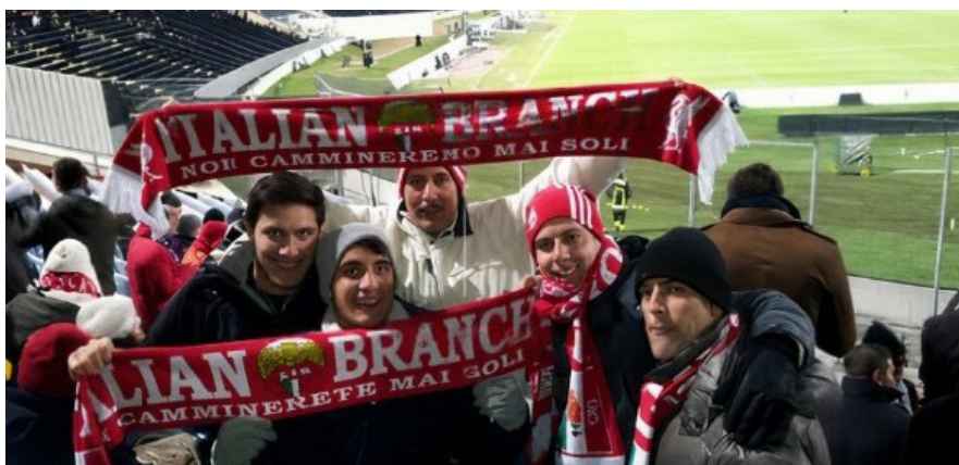
La trasferta dei Reds ad Udine nel 2012

troppa gente, non amo i social. Apprezzo molto il podcast e gli articoli delle partite.