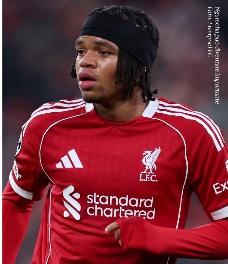
Ngumoha può diventare importante