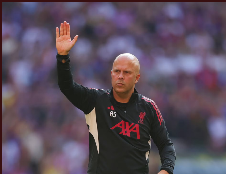
La rottura con Slot è stata difficile da gestire per la tifoseria