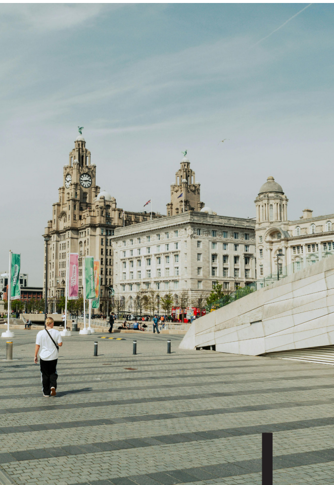
Il Liverbird Building visto dai docks

Cammini sul waterfront, costeggi il fiume Mersey verso sud, mentre l'ultimo sole del giorno riflette sull'acqua e ti acceca, negandoti la vista di Birkenhead, sull'altra sponda. Il richiamo del Liverbird ti risuona nell'orecchio sinistro, la città ti invoca e ti fa voltare dolcemente. Ammiri le tre grazie illuminate di sguincio dai deboli raggi rossastri, pronti a cedere il testimone al crepuscolo della sera, all'oscurità della notte. Una sensazione ti scalda il cuore, ti colma l'anima. È la fede che ti lega a quel posto, la passione che ti muove ogni fine settimana. Essere tifosi del Liverpool non è una questione che si può spiegare e analizzare, è una cosa che si sente, è un legame che, col passare del tempo, stringe il nodo sempre più stretto. Non è neanche importante a che latitudine siamo nati, conta solo come si è fatti. Essere tifosi del Liverpool è una fede che non si può scegliere. Si viene scelti, come adepti incaricati di spargere un amore più grande. Essere tifosi del Liverpool ha sempre voluto dire qualcosa in più. This means more. Ma se spiegarlo con parole nostre