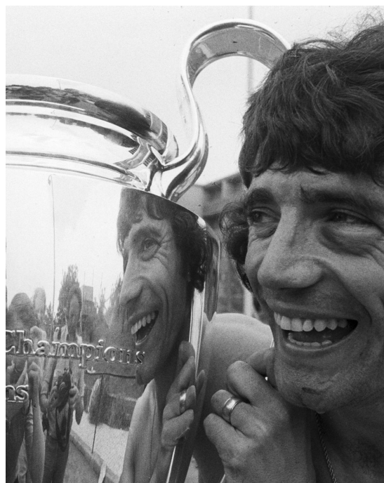
Keegan alla parade della Coppa dei Campioni

McDermott, Callaghan e Smith firmano le reti, ma è Keegan a illuminare la notte dell'Olimpico, simbolo di un calcio che corre più veloce del tempo. Dopo Roma, Keegan lascia Liverpool per l'Amburgo, dove vincerà il Pallone d'Oro, e poi approda al Southampton, il club che in Inghilterra chiamano "il cimitero degli elefanti". Ma lui trasforma la battuta in miracolo: "Il Re è diventato Santo" , titolava la stampa italiana. Con la nuova maglia biancorossa, Keegan continua a stupire, trascinando una squadra di provincia con la stessa energia dei giorni di Anfield. Oggi, la notizia del suo cancro in stadio avanzato, riporta alla memoria non solo il giocatore, ma l'uomo che ha insegnato a vincere con umiltà e passione. Keegan non era solo un attaccante: era un simbolo di rinascita, di calcio totale, di spirito inglese. Il suo sorriso con la Coppa dei Campioni tra le mani (in foto) resta una delle immagini più luminose del football europeo. E mentre tutto il mondo del calcio lo abbraccia con affetto, Roma e Anfield sembrano ancora unite da un applauso che non si spegne.