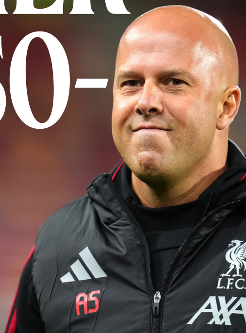
Arne Slot nella stagione 2025/26